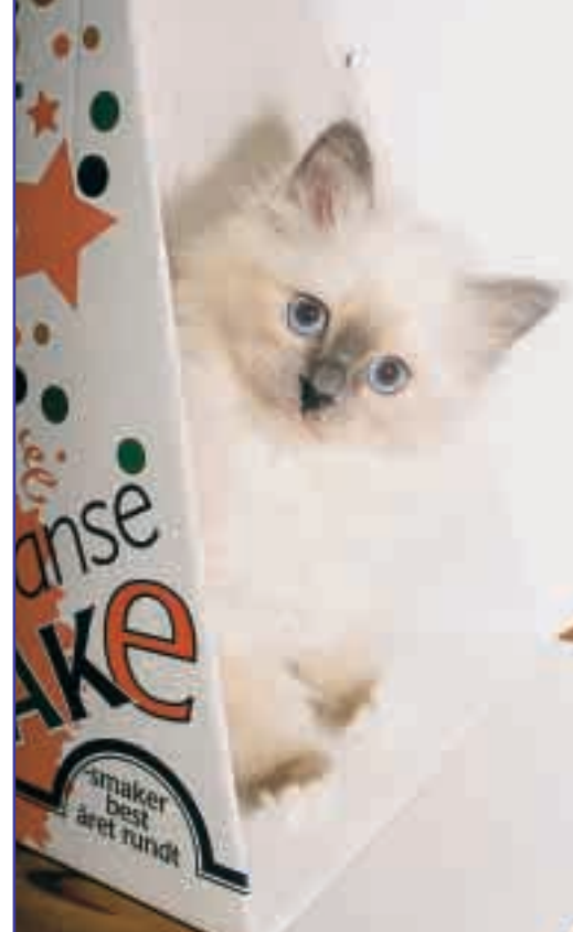
Lainie de Luxe av Ontario. Eier: Gerd Wickmann.

Hellig birma – den vakreste av alle (artikkel i Aristokatt nr. 4 – 1999)