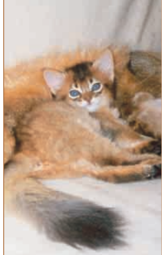
Asterix av Fristad (N). Oppdretter/foto: Tanja Braathu