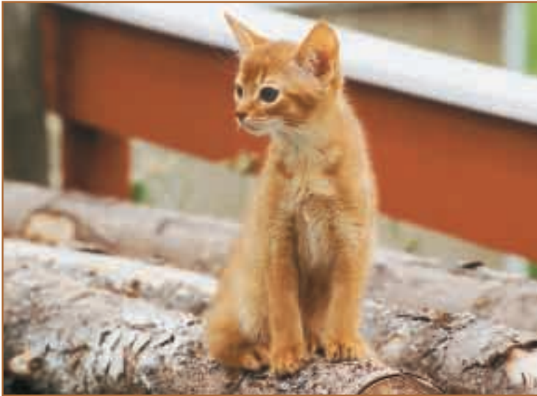
Awendela av Wild Paw (N). ABY