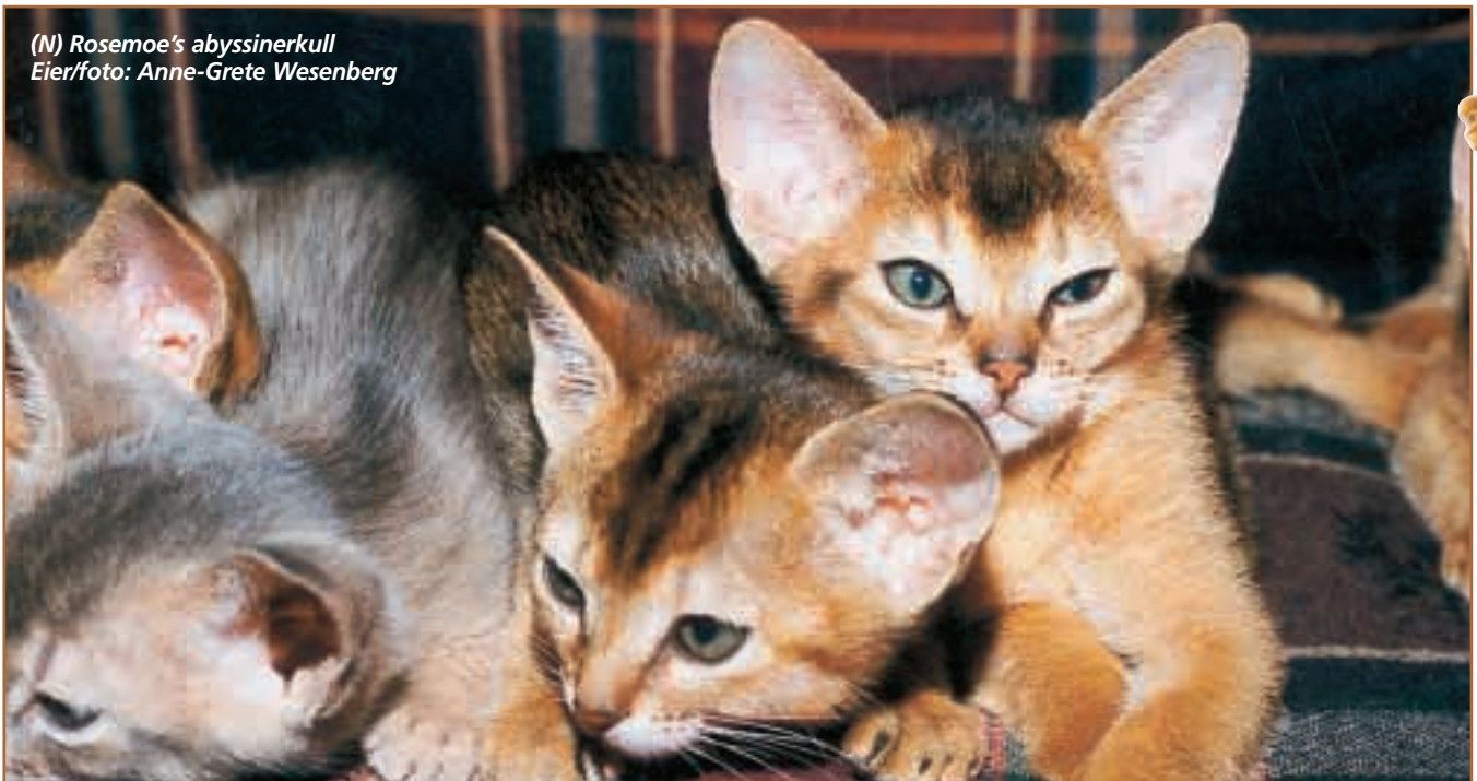
(N) Rosemoe's abyssinerkull Eier/foto: Anne-Grete Wesenberg