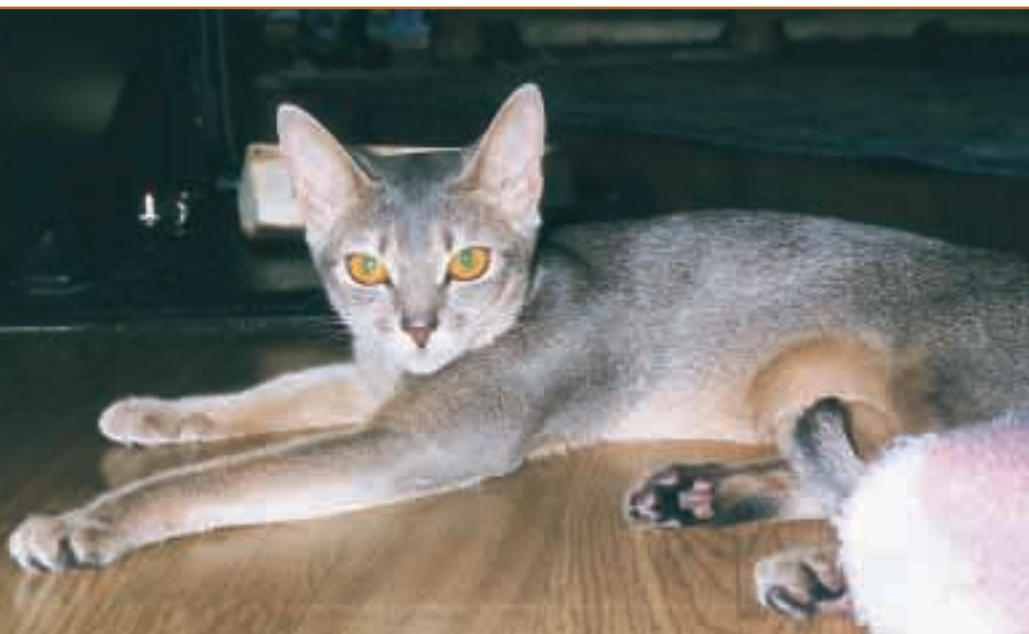
(N) Rosemoe's Blue Emma, ABY a Eierfoto: Kitty Söderström, oppdretter Anne-Grete Wesenberg