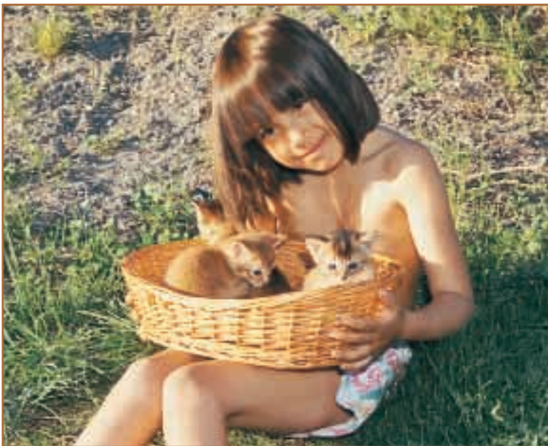
Kull fra av Wild Paw (N).