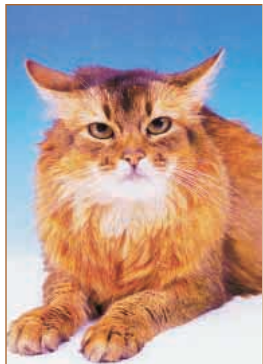
EPIEC Sanddrop's Beate. Født 15/2-85. Katten ble EC som semilanghår, Kat. II og EP som korthår, Kat. III.