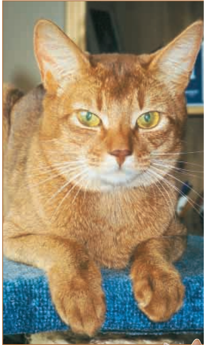
Amadeus De Lux av Sina Bass (N). ABY o SOM/IVAR Eier: Katarina Søderstrøm, Oppdretter: Kitty Søderstrøm.