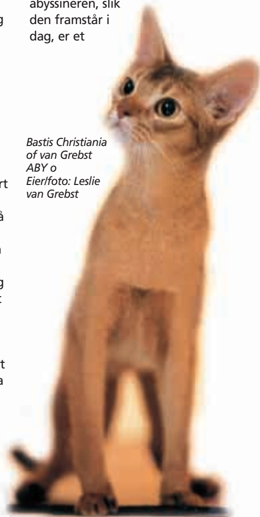
Bastis Christiania of van Grebst ABY o